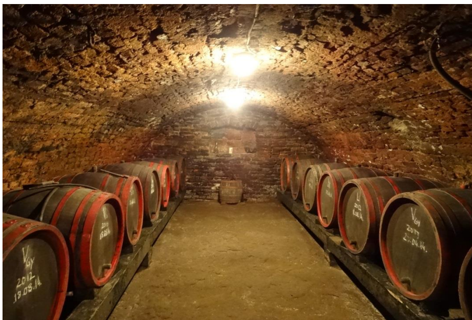
Fig. 24. Crama din Ciumești (datată 1786)

recente. Potențialul de integrare în cadrul activităților agroturistice derivă din inducerea unui peisaj viticol specific, dar și din posibilitatea includerii acestor pivnițe (Pir, Sălacea), în circuite oenologice. Nu mai puțin importante ca potențial de valorificare turistică sunt cramele, mai puține dar extrem de valoroase ca potențial, unele fiind amenajate ca atare și valorificate pe plan local (Ciumești).